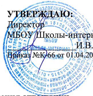
График проведения аттестации