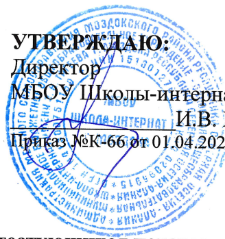
График подготовки представлений на аттестующихся педагогических работников