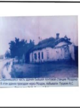
Сохранившаяся часть здания бывшей почтовой станции Моздок. В этом здании проездом через Моздок, побывали Пушкин А.С.