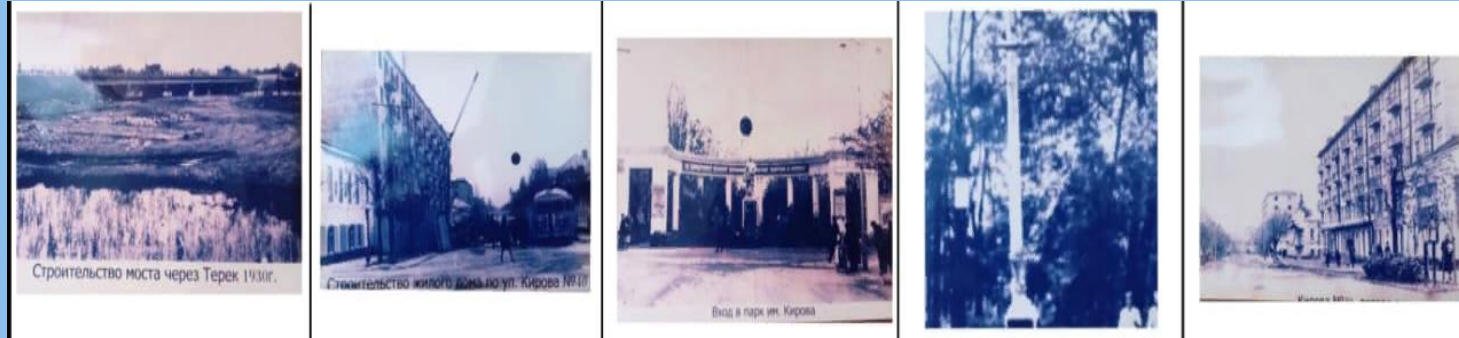
Строительство моста через Терек 1930г.