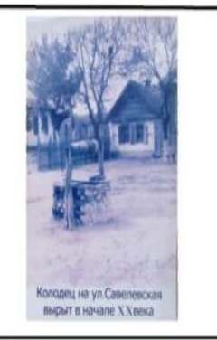
Колодец на ул. Савелевская вырыт в начале XX века