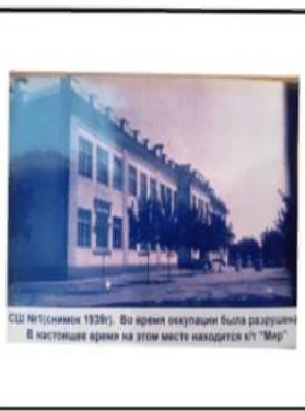
СШ №10(нынешн 1939г.). Во время оккупации была разрушена. В настоящее время на этом месте находится ул "Мир"

Продолжение ул. Кирова выходящей на р. Терек (мост разобран во время Отечественной войны)