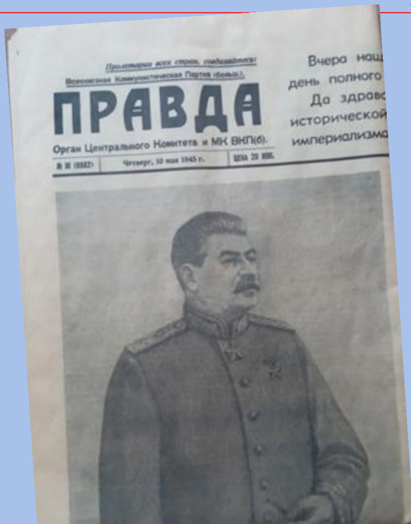
Газета «Правда» 10 мая 1945 года