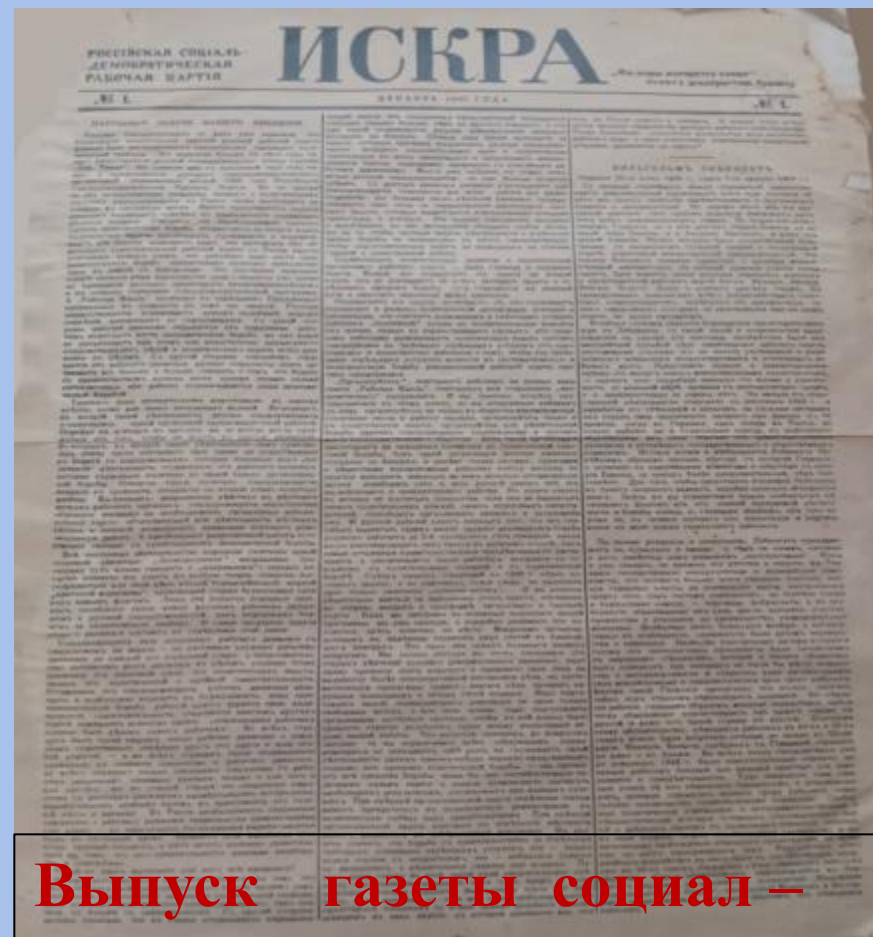
Выпуск газеты социал – демократической рабочей партии «Искра» (декабрь 1900 г.)