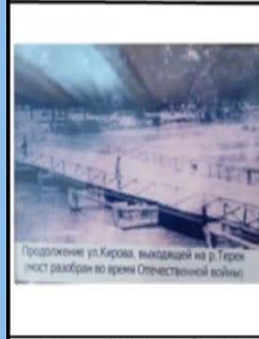
Продолжение ул. Кирова, выходящей на р. Терек (мост разобран во время Отечественной войны)